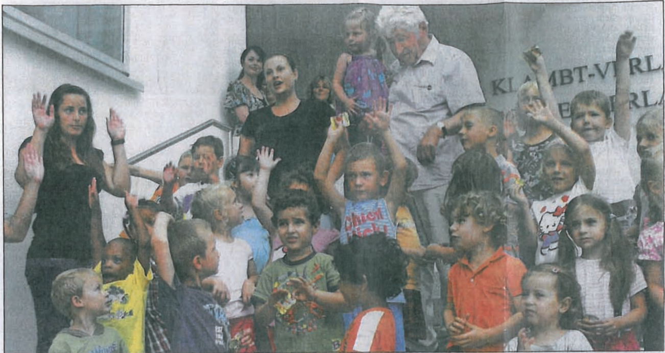
SINGSTUNDE MIT DEM VOLKSLIED-GURU: Die Vorschulkinder vom Familienzentrum brachten Gotthilf Fischer ein Ständchen.